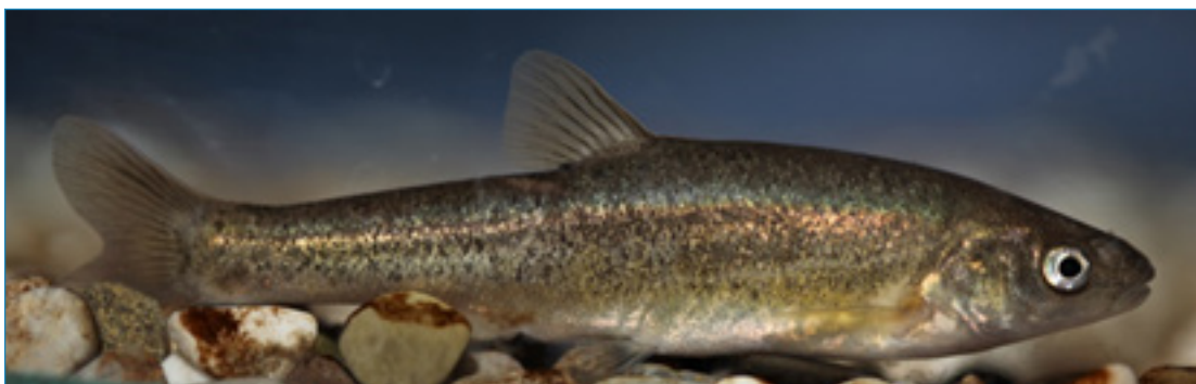
Slika 1. Krbavski pijor ( Delminichthys krbavensis )

Krbavski pijor (slika 1.) je mala stenoendemska vrsta ribe iz porodice Cyprinidae (šarani) i reda Cypriniformes (šaranke) koja dostiže totalnu dužinu tijela oko 100 cm. Krbavska gaovica prekrivena je malim razmaknutim ljuskama koje su ponekad teško uočljive ili nedostaju, naročito za vrijeme mrijesta kada koža zadeblja. Tijelo je vretenasto i bočno spljošteno s prekinutom bočnom prugom koja obično završava iza prsnih peraja ili iznad baze podrepne peraje. Leđna strana tijela je tamno obojena te posuta manjim ili većim crnim mrljama nepravilnog oblika. Od ostalih pripadnika roda Delminichthys razlikuje se sljedećom kombinacijom obilježja: udaljenost između osnove trbušnih i osnove podrepne peraje je kratka, gubica je zaobljena i zdepasta sa poludonjim ustima, a u bočnoj prugi ima 20-40 probušenih ljusaka.