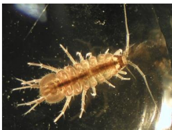
1.1.9. Red Isopoda

Pošto su gustoćom populacija često dominantni ili subdominantni u zajednicama litorala (posebice u tekućicama), rakušci su važan posrednik između primarne i sekundarne produkcije. Razlaganjem nežive organske tvari pomažu oslobađanju hranjivih tvari vezanih u detritusu te njihovom kruženju. Prema funkcionalnim grupama beskralješnjaka u tekućicama rod Gammarus spp. se smatra glavnim usitnjivačem velike količine krupno partikulirane organske materije kao što je listinac (MacNeil i sur. 1997). Rakušci su važan izvor hrane za karnivorne beskralješnjake, ribe i druge kralješnjake te se često navode kao bitan ili čak glavni izvor hrane za razne vrste riba. Kao predatori rakušaca navode se i ličinke daždevnjaka. Riječne vrste rakušaca su posebno osjetljive na predaciju tijekom drifta, kada ih intenzivno love ribe i vodene ptice (MacNeil i sur. 1999).