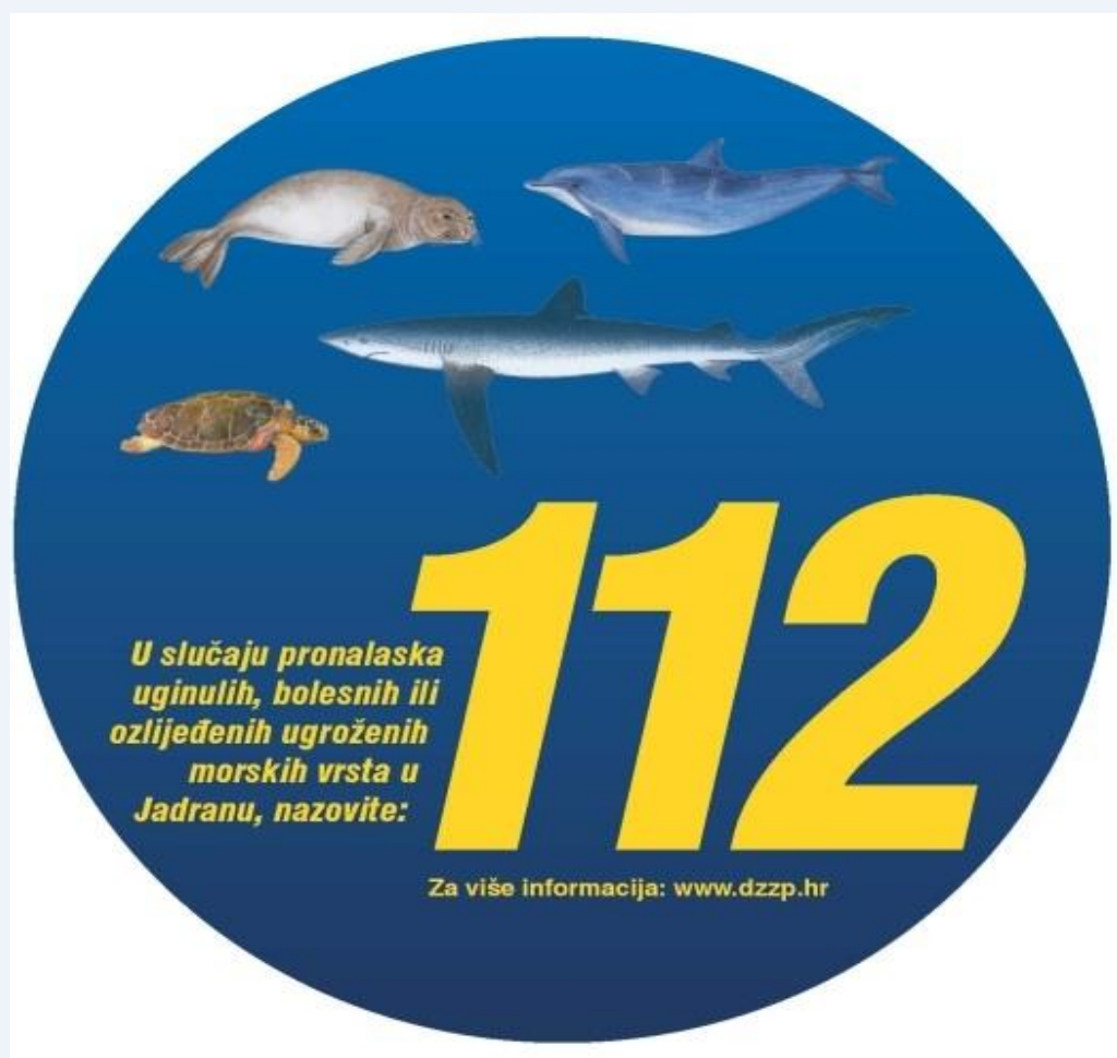
Slika 1. Informativni materijal u obliku naljepnice