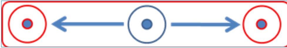
Slika 4. Primjer pomaka monitoring lokaliteta (crveni krugovi) za jadvovsku gaovicu u slučaju izostanka jedinki vrste na planiranom lokalitetu (plavi krugovi)

U slučaju da na 40% odabranih lokaliteta potpuno izostanu jedinke D. jadvovensis , monitoring na tim lokalitetima treba u istoj godini ponoviti, ali točke uzorkovanja pomaknuti uzvodno i nizvodno do prvog mjesta sa sličnim fizikalno-kemijskim i stanišnim značajkama. U slučaju da nakon toga i dalje izostane nalaz vrste monitoring treba ponoviti odmah slijedeće godine kako bi se utvrdilo da li je nepojavljivanje posljedica problema u uzorkovanju, trenutnim oscilacijama populacije ili stvarnim padom brojnosti odnosno smanjenjem promatrane populacije.