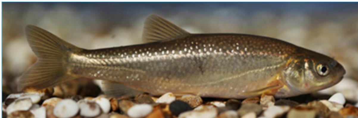
Slika 1. Hrvatski pijor ( Telestes croaticus )

Hrvatski pijor (slika 1.) je relativno mala endemska riba iz porodice Cyprinidae (šarani) i reda Cypriniformes (šaranke) koja dostiže maksimalnu standardnu dužinu tijela 165 mm. Gornja trećina tijela je tamnije obojena, a po leđima se, od stražnjega dijela glave do leđne peraje (u pojedinim jedinka i do repne peraje), proteže tamnozeleno pruga. Bokovi i trbuh su srebrnastobijeli. Od ostalih pripadnika roda Telestes razlikuje se sljedećom kombinacijom obilježja: ljuske su mu vrlo takne i ne preklapaju se, a posebno su razmaknute u prednjem dijelu tijela, od oka do kraja repnog drška proteže se tamna crna pruga koja se nalazi unutar pigmentiranog dijela leđa i bokova, u leđnoj peraju ima 71/2 razgranatih šipčica, u podrepnoj peraji ima uglavnom 81/2 rijetko 71/2 razgranatih šipčica, stražnji rub leđne i podrepne peraje je zaokružen, gubica je zaokružena sa poludonjim ustima, bočna je pruga obično malo prekinuta i u njoj ima od 51-70 probušenih ljusaka..