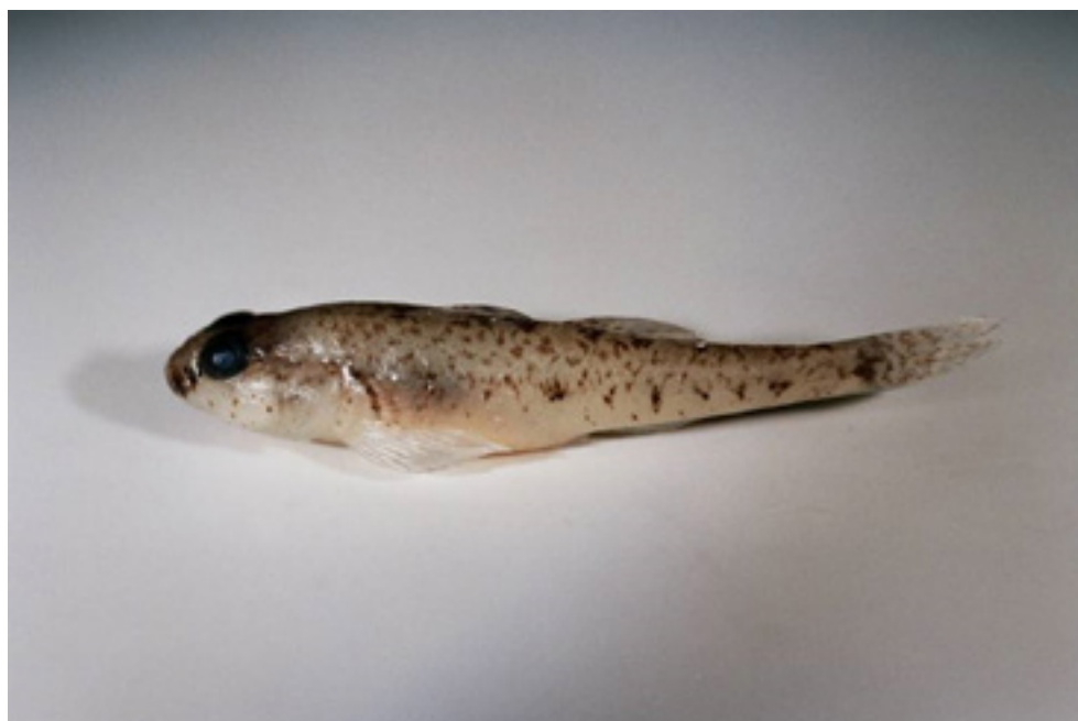
Slika 5. Ženka glavočića crnotrusa Pomatoschistus canestrinii.