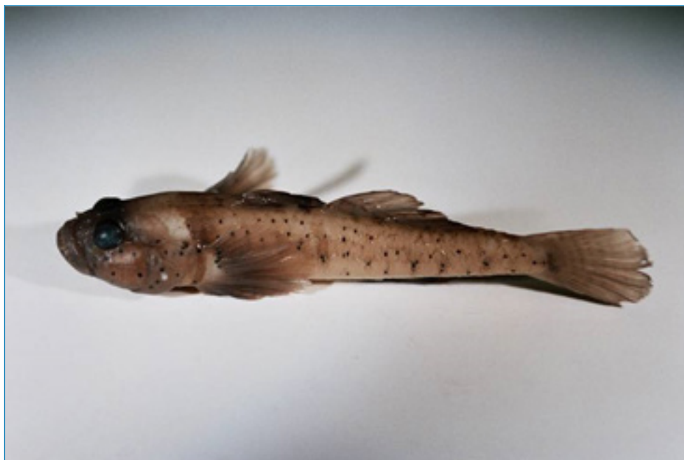
Slika 4. Mužjak glavočića crnotrusa Pomatoschistus canestrinii.