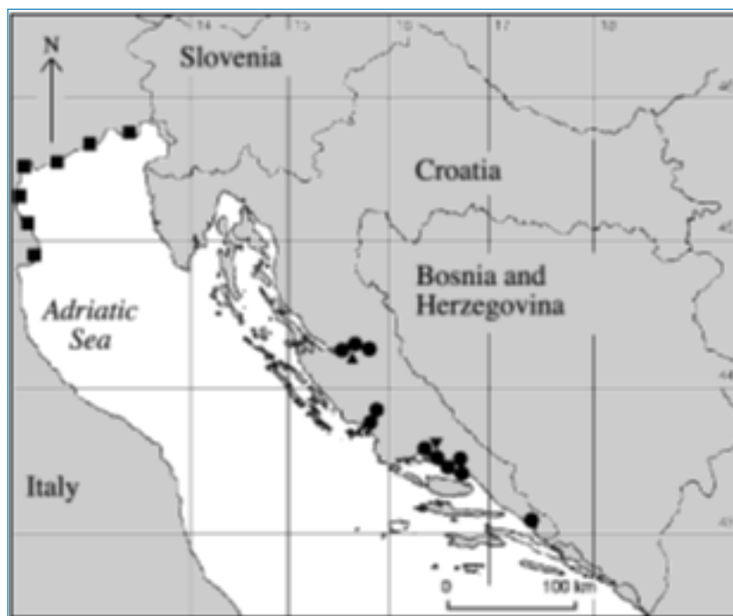
Slika 1. Rasprostranjenost vrste P. canestrinii (Kovačić, 2005).

P. canestrinii je u Crvenoj knjizi slatkovodnih riba Hrvatske uvrštena u kategoriji ugrožene vrste (EN) (Mrakovčić i sur., 2006). Na Europskom crvenom popisu slatkovodnih riba i u globalnom crvenom popisu uvrštena je u kategoriji najmanje zabrinjavajuće vrste (LC) (Freyhof i Brooks, 2011; IUCN, 2013).