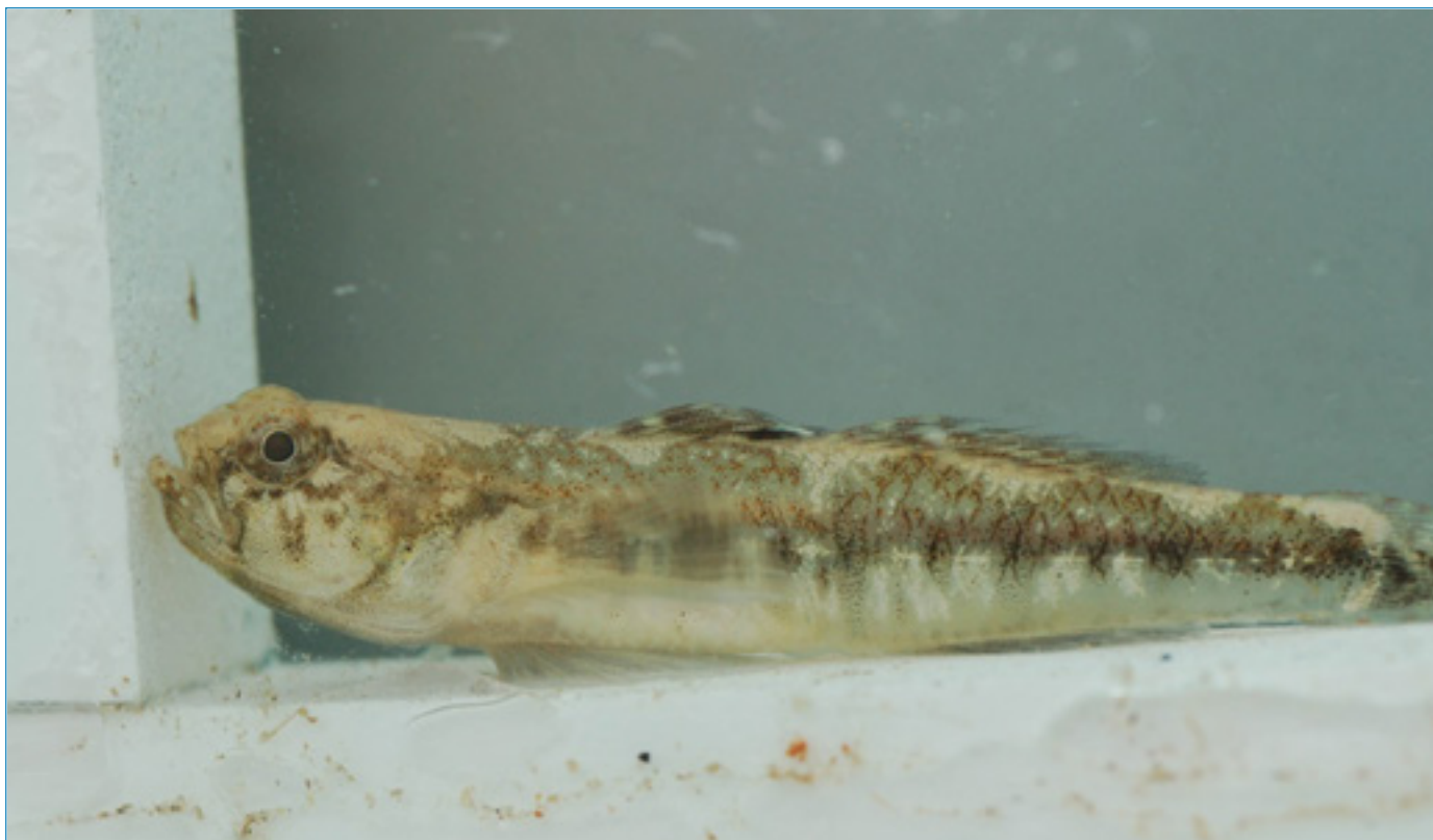
Slika 3. Mužjak glavočića vodenjaka Knipowitschia panizzae.