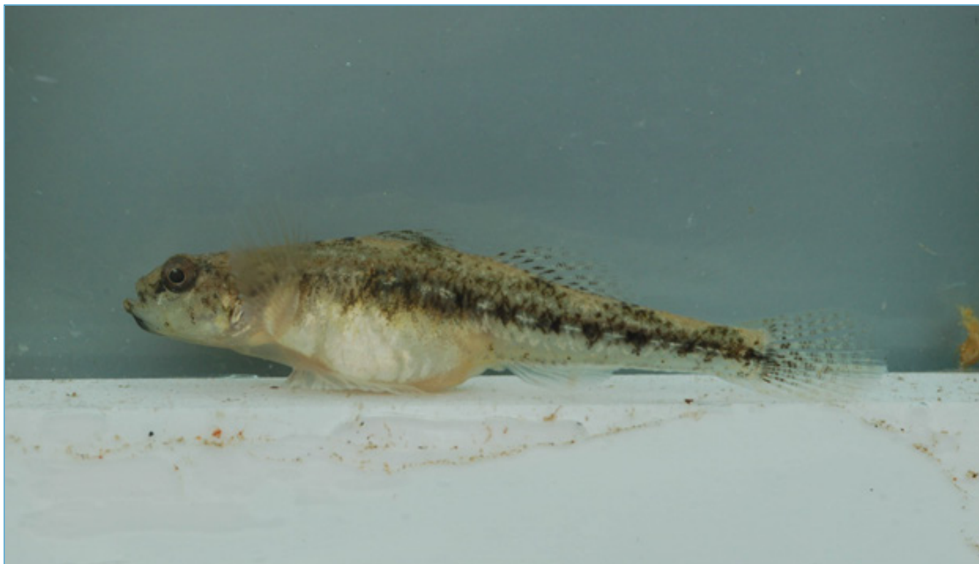
Slika 4. Ženka glavočića vodenjaka Knipowitschia panizzae.