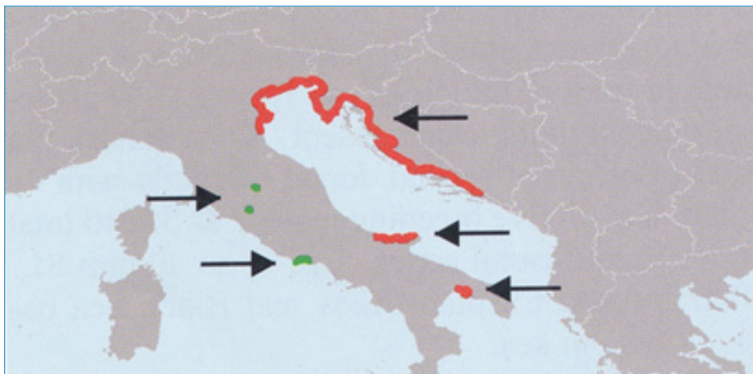
Slika 1. Rasprostranjenost vrste Knipowitschia panizzae (iz Kottelat i Freyhof, 2007).

Ugroženost vrste K. panizzae nije procijenjena u Crvenoj knjizi slatkovodnih riba Hrvatske (Mrakovčić i sur., 2006) i u Crvenoj knjizi morskih riba Hrvatske (Jardas i sur., 2008). Na Europskom crvenom popisu slatkovodnih riba i u globalnom crvenom popisu uvrštena je u kategoriji najmanje zabrinjavajuće vrste (LC) (Freyhof i Brooks, 2011; IUCN, 2013).