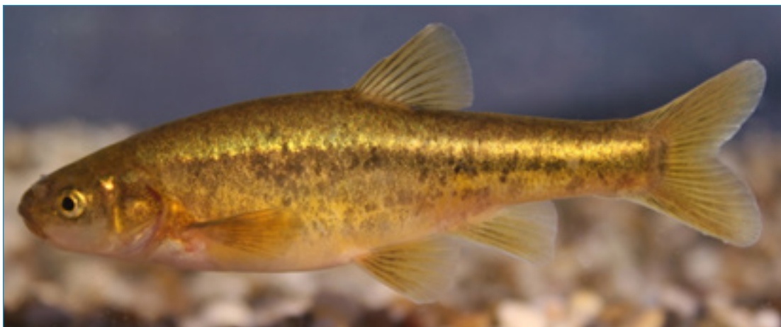
Slika 1. Jadovska gaovica ( Delminichthys jadovensis )

Jadovska gaovica (slika 1.) je mala endemska riba iz porodice Cyprinidae (šarani) i reda Cypriniformes (šaranke) koja dostiže standardnu dužinu tijela od 93 mm. Tijelo joj je bočno spljošteno s dugačkim repnim drškom te jednolično obojeno, a leđa i bokovi posuti su brojnim crnim mrljicama nepravilnog oblika. Bočna je pruga isprekidana i u njoj obično brojimo 51-60 probušenih ljusaka. Usta su završna. Leđna i podrepna peraja imaju 71/2 razgranatih leđnih šipčica. Tijelo je prekriveno malim, nježnim, ovalnim ljuskama koje su duboko usađene u kožu. Od ostalih se pripadnika roda Delminichthys razlikuje kombinacijom sljedećih osobina: završna usta na šiljatoj gubici, zadebljana koža osobito kod jedinki u mrijestu, bočna pruga može i ne mora biti prekinuta i završava na repnom dršku, ljuske na bočnoj prugi se preklapaju i veće su od ostalih ljusaka na tijelu.